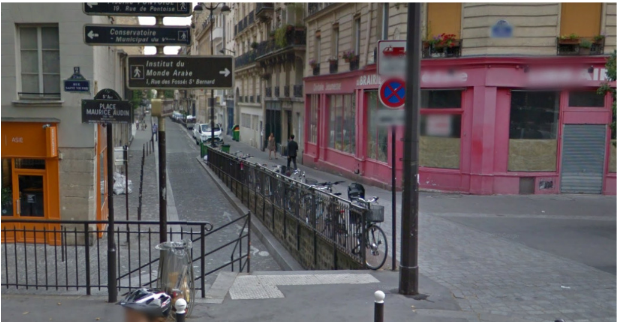
Rue des Écoles, Paris