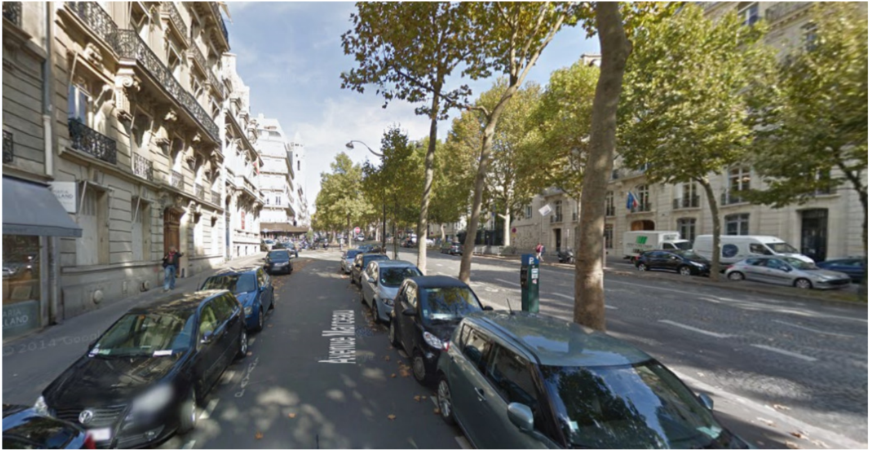
Avenue Marceau, Paris