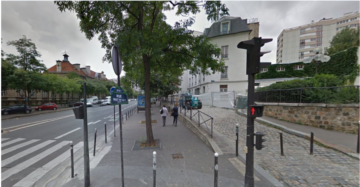
Rue Watteau, Paris